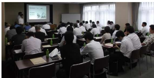
【大阪府での講演会の様子】